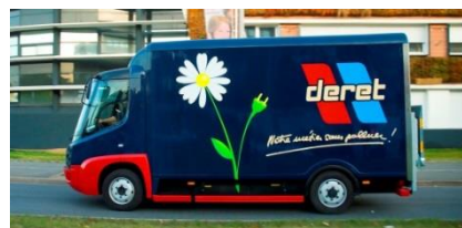
Les véhicules sont fournis par la société Deret d'Orléans

L'ELU est tout simplement une plate-forme logistique intermédiaire, où les marchandises sont déposées. Un camion électrique les prend en charge, et va livrer une bonne dizaine de magasins à la fois. Avantage, moins d'embouteillages, et moins de pollution. Trente et un point de vente, Séphora, Lafuma, Dior, L'Oréal, Marionnaud etc, sont ainsi livrés, depuis le mois de Mars, ce qui représente deux-cent-cinquante palettes et près de mille cinq-cents colis livrés chaque mois. Deux camions électriques sont sur la nouvelle plate-forme, ce qui permet une économie de quatorze tonnes par an de gaz à effet de serre.