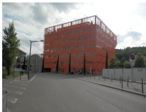
Le cube orange

Deux-cent-vingt-cinq logements présents sur 15.600 m 2 , des commerces et des bureaux sont prévus, ainsi que la Maison de la Danse qui doit être construite dans les prochaines années.